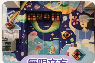
無限立方 (沉浸教室)