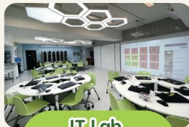
IT Lab 創科培訓中心